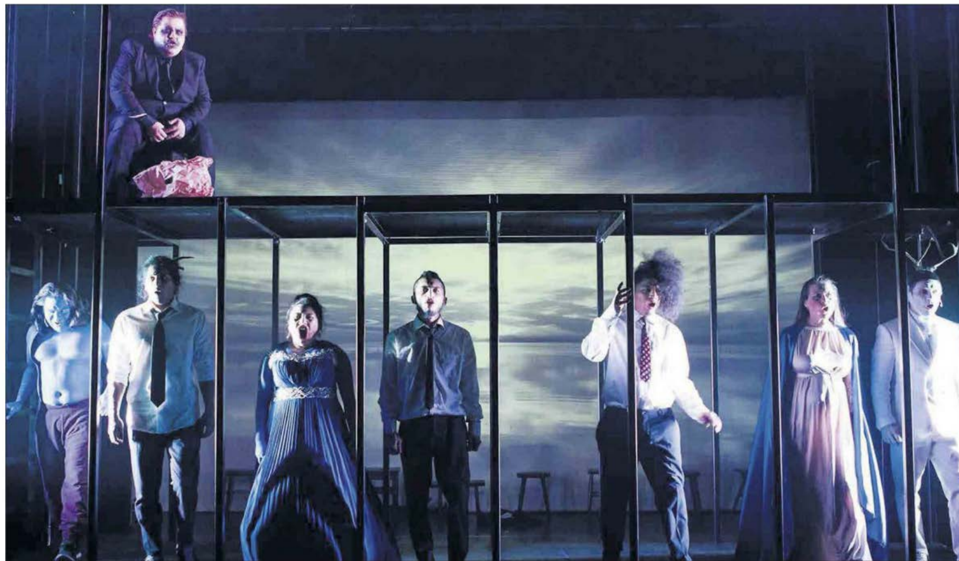
PÅ TVERS AV KULTURER: I den Heddaprisvinnende forestillingen «Vidas Extremas» møter den samiske kulturen mayakulturen.

– Dette teateret har aldri laget likkjøpte forestillinger. Vi