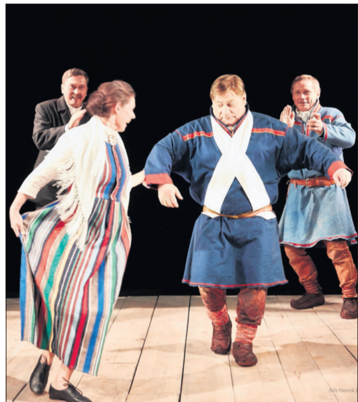
SJØSAMER: Handlingen er lagt til et sjøsamisk miljø på 1920-tallet.

«Nattskygge» gir en skremmende og realistisk framstilling av evig-aktuelle problemstillinger som